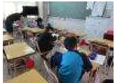
集中して取り組んでいます！