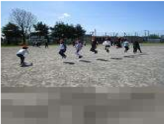
5年生 種目：「80m徒競走」「チームジャンプ」「西っ子ソーラン」 練習する毎に記録がだんだん伸びてきた「大縄跳び」。気持ちを1つに頑張ります！