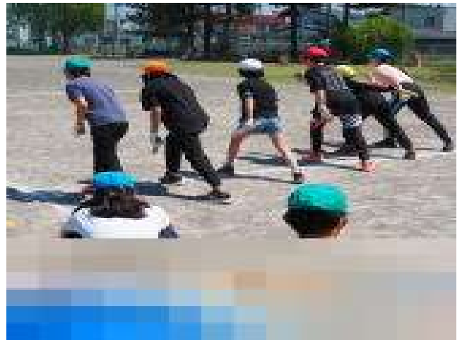
6年生 種目：「80m徒競走」「全員リレー」「西っ子ソーラン」 最後の運動会！どの学年よりも熱い練習をしていました。熱い走りと踊り，期待大です