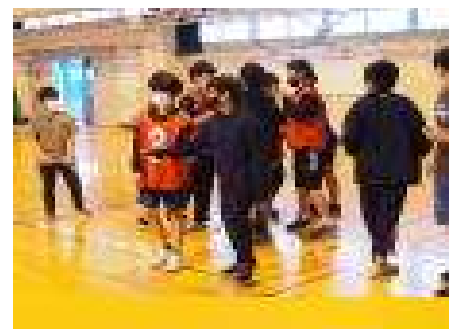
↑ 係活動打合せ・練習中の場面です

「西っ子ソーラン」では、6年生が前に立って練習を進める時間もありました。永山西小のよき伝統を引き継いでいます！5・6年生による迫力ある踊りをお楽しみください。 また、6年生は係活動で1・2年生の1部から活躍します（5年生は、一部の児童のみですが6年生競技のお手伝いを行います）。学校のために頑張る姿が下級生のよいお手本になってくれることを期待しています。