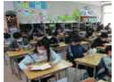
昼読書の時間としても活用