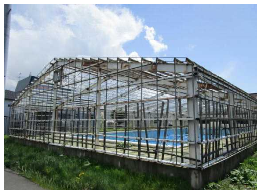
西小プール 長い間ありがとう

つきましては、新しいプール施設が完成するまでの間、同じ永山地区である永山東小学校のプールを使用させていただくことになりました。6月15日から各学級とも2回程度の水泳学習を実施していきます。学校から永山東小までの移動は、旭川市教育委員会より貸切バスが手配されます。詳細は、後日文書でお知らせいたします。