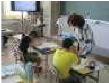
少人数指導の様子①