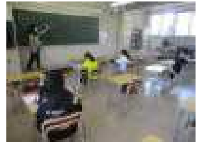
少人数指導の様子②