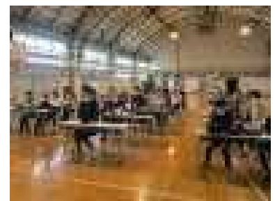
講師によるICT職員研修を開催