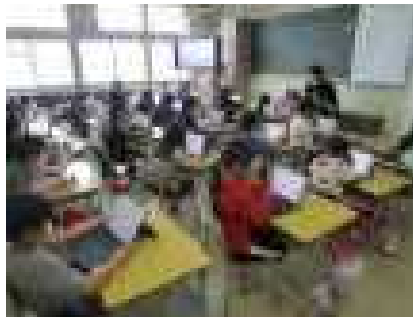
清掃時間にタブレット学習を実施