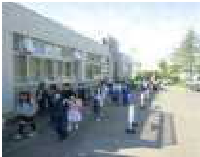
朝の玄関前 待機場所を設置

今後も児童の安全確保に努め、引き続き、各ご家庭のご協力をいただきながら、教育活動を推進していきたいと考えています。