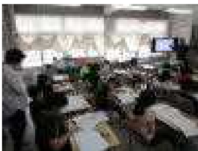
担任とともに学習指導

また、本校では、放課後の時間に校内研修を定期的に行い、全教職員で、授業改善や学級づくりについて研修や交流に取り組んでいます。