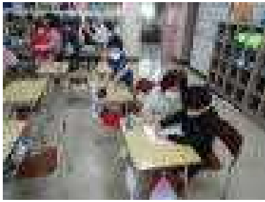
TT指導の様子 T2が個別支援

本校では、主に算数の学習でTT（チームティーチング）指導や少人数指導に取り組んでいます。1・2年生では、TT指導を行い（T1が担任で一斉指導、T2が指導員で個別支援）、きめ細かい指導をしています。3年生以上の学年では、学級をいくつかのグループに分けて少人数指導をしています。学習内容の定着度に合わせてグループ編成を行い、各グループに合わせた指導方法を工夫するなど、確かな学力向上をめざして様々な手立てを講じています。