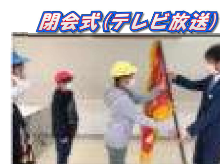
閉会式(テレビ放送)

今年度の総合結果は 1位 黄組643点 2位 赤組551点 3位 青組530点 となりました。 どの組もよく頑張りました！