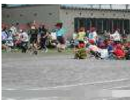
5年生 チームジャンプ