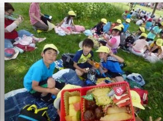
2年生 旭神中央公園