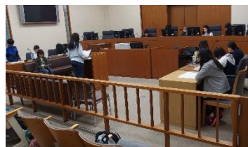
札幌自主研修 ～裁判所での模擬裁判