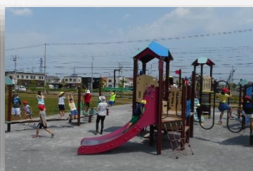
4年生 ひじり野西公園