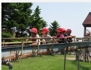
1年生 西御料～御料公園

晴天に恵まれた7日、1～4年生は遠足に出かけました。出発式では、学年の代表が行先やめあてを発表しました。長い距離を歩きましたが、目的地では事前に話し合われた学年や学級での全員遊びなどを通して、クラスの仲間はもちろん、学年みんなとの交流も活発に行われました。もちろん、おいしいお弁当が遠足の大きな楽しみのひとつだったのは言うまでもありません。