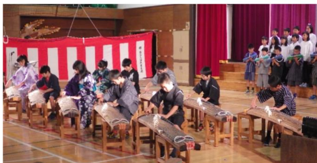
5年生 『To the world ひろい世界へ』