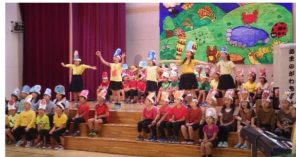
2年生 『のはらうたわいわいコンサート』