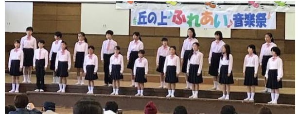
丘の上ふれあい音楽祭