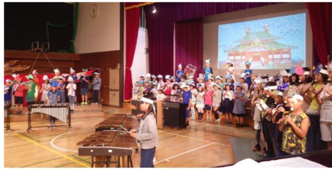
4年生 『浦島太郎 in ニシゴ』