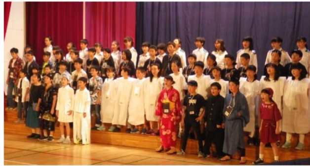
6年生 『夢からさめた夢』