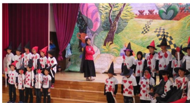
3年生 『アリスインワンダーニシゴ』