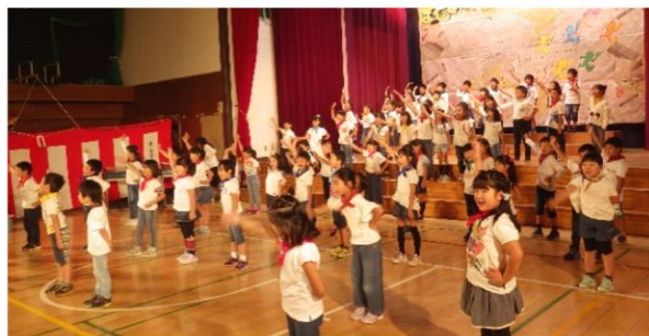
1年生 『はじめのいっぽコンサート』

学習発表会について保護者の皆様からいただきました回答とご感想の一部を次ページに掲載させていただきました。今後とも「すべては御料っ子のために」を合い言葉に、保護者や地域の皆様とともに、学校教育目標の実現に向けて教育活動を推進してまいります。