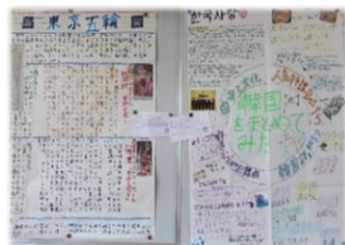
力作ぞろいの作品