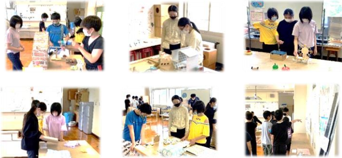
学年ごとの児童鑑賞会の様子

8月23日(月)～30日(月)の期間に、夏休み作品展が開かれました。手作りの潜水艦や空気砲、ヘアードネーションのレポート、工夫を凝らした観覧車貯金箱、色鮮やかな手作り石けん、きれいな水をつくり出す過装置など、どれを見てもワクワクする作品でした。学年ごとに鑑賞し、作品のよさや工夫を楽しみました。