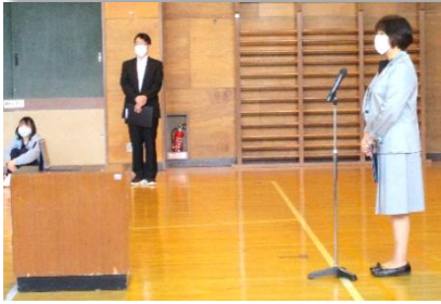
リモート始業式の様子

8月20日(金)、2学期の初日、新型コロナウイルス感染症対策として、iPadを活用したリモート始業式を行いました。密を避けるため、代表児童3名と2年生18名は体育館、他の児童は各教室での参加となりました。また、代表児童は、夏休みの楽しかった思い出や頑張ったこと、2学期に向けての抱負について堂々と発表し、コロナに負けず、笑顔で2学期をスタートさせました。