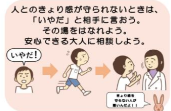
【指導資料から抜粋】