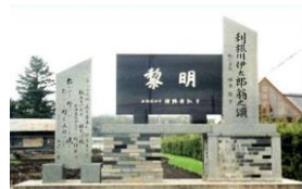
林産試験場横に立つ記念碑