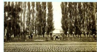
神楽西第一尋常小学校