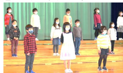
1年生による校歌斉唱

新型コロナウイルスによる感染症の影響は広がる一方です。学校の教育活動にとっても困難な状況は続きますが、こうした状況も新たな機会ととらえて前へ進むことができることを子どもたちに教わった気がしています。