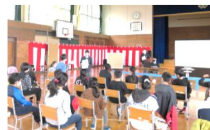
生徒会役員に質問をする様子

その後、10日間、記録カードを活用するなどして生活習慣を振り返り、アウトメディアにチャレンジしました。その結果、「宿題・家庭学習を終えるまでテレビ・ゲーム・インターネット・スマホをいせん！YouTubeを見せん！」などの目標1や「家族との話す」や「お手伝い」などの目標2を意識し、実践することができました。