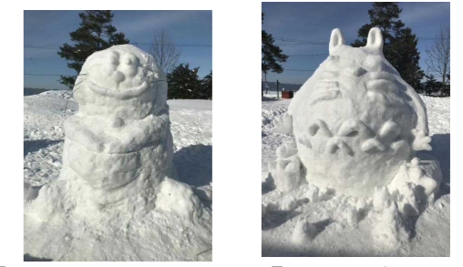
「ドラえもん」(1年) 「トトロ」(2年)

児童玄関前には、各学年が制作した雪像が2体並んでいます。来校の際には是非ご覧ください。