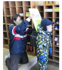
玄関での検温チェック

令和2年も様々なことがありました。猛暑、オリンピック・パラリンピックの延期、新首相、米大統領選挙、本校にとっては開校120周年の記念すべき年でもありました。ただやはり念頭に浮かぶのは新型コロナウイルス関連の出来事です。学校も大きく変わりました。感染症対策としての臨時休校、分散登校。授業時数確保のための夏休み・冬休みの短縮。遠足やマラソン大会をはじめとする様々な学校行事の中止。運動会や学芸会の開催方法の変更。修学旅行の目的地変更。「学校の新しい生活様式」のもとでの毎日の授業、友達との交流や給食・清掃。マスク着用と手洗いの徹底、毎日の検温、玄関前での健康チェック、校舎内の消毒等々も継続して行われています。