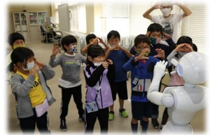
【1年生が Pepper とリズム体操】

3～6年生のプログラミング学習に協力してくれる Pepper が今年度も大町小学校に来てくれました。残り1週間ほど…9月30日（木）までの在校期間ですが、次々と Pepper に指令を与えることができる子どもたちの様子に驚かされています。