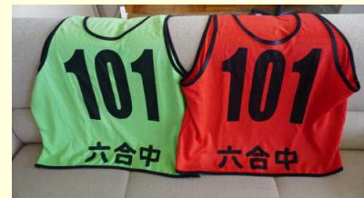
購入したビブス(1・2年用)

最近の社会的な情勢を踏まえると、来年度はさらに一歩前進した活動ができるのではないかと予想しています。活動推進のためには、保護者の皆様や地域の皆様のご協力をいただくことが必要となってきます。どうぞよろしくお願いいたします。