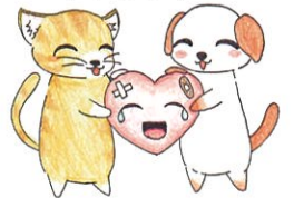
コールちゃん エールくん