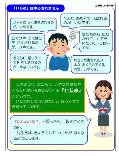
いじめ防止基本方針(児童版) (低学年向け) より

なお、緑新小のホームページに「学校いじめ防止基本方針」や「児童版」 を掲載していますので、ご確認ください。