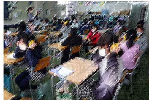
聞こえにくいヘッドホン体験