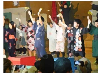
「M(ミュージック) - 1 グランプリ」の様子から