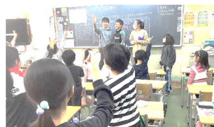
6年生と一緒にゲームをする様子

11月8日（水）、前回から延期となっていた緑新活動が行われました。コロナ禍を経て4年ぶりの開催となりました。緑新活動とは、全校を12班に分けた縦割り班で、異学年交流を目的としたものです。今回の緑新活動は「なかよし集会」で、1年生から6年生までがそれぞれの活動場所に集まり、自己紹介をしたりゲームをしたりしました。6年生を中心に進行し、どの班からも歓声上がるなど、大変盛り上がりました。次回の緑新活動は、3学期に「6年生を送る会」を行います。在校生からお世話になった6年生に感謝の気持ちを伝える思い出深い会となります。