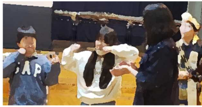
ムックリなどを体験する様子

10月31日(火), 4年生を対象としてアイヌ民族音楽会が行われました。社会科「きょう土の伝統・文化と先人たち」の学習の一環として, アイヌ語の歌や踊りを実際に体験し, その文化に関心をもつことができました。その後の学習でも, アイヌの文化や歴史について意欲的に学ぶ様子が見られました。