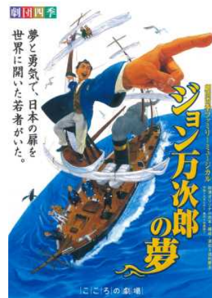
当日のパンフレットより

8月25日（金），6年生は，旭川市民文化会館大ホールで上演された劇団四季によるミュージカル「ジョン万次郎の夢」を鑑賞しました。ミュージカル鑑賞が初めてという子も多く，とても楽しみしていた行事です。期待していたとおり，すばらしい歌やダンス，多彩な舞台演出に，子どもたちは大いに魅了されました。幕末の実際にあった出来事を題材にしていたこともあり，歴史を学習している6年生にとっては，とても興味深い内容でした。子どもたちは，ミュージカルを楽しむだけではなく，係員の人などにしっかり挨拶したり，マナー良く集中して観劇したりし，とても立派な態度でした。そして，感性を働かせながら劇団四季の豊かな表現力を堪能することができました。