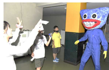
6年学年レクの様子

86日間の2学期がスタートしました。今学期も「やる気」と「友達と共に（協働的な達成感）」を引き出すことを軸に、指導の更なる充実を進めてまいります。家庭での心の居場所づくりを今後もお願いすると共に、子どもが心を許せる温もりのある学校・学級づくりのために、早めの教育相談やお力添えなど、家庭や地域の皆様のご支援を今学期もどうぞよろしくお願いいたします。