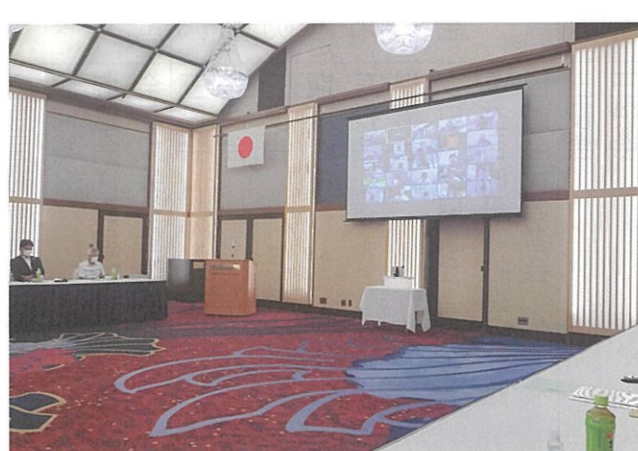
ソーシャルディスタンスと換気を考慮した部屋にて臨時総会対応

我々、公益社団法人日本PTA全国協議会としても、この令和2年度は例年とは違う形での活動を余儀なくされており、既に公益目的の事業の中止や延期・縮小をして 日本最大の社会教育関係団体として全国約800万人の会員の皆様のため、そして大切な子ども達の明るい未来のために活動して参りますので、どうか引き続きご支援・ご協力のほど、なにとぞ宜しくお願い致します。