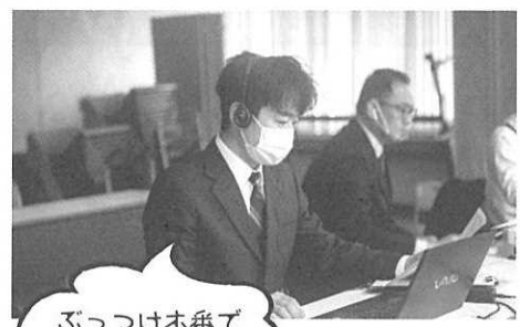
ぶっつけ本番で司会進行を務めた長登研修部長