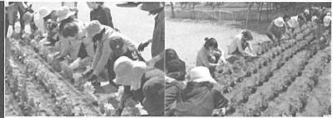
令和元年度 東明中学校 PTA活動から