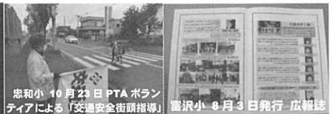
忠和小 10月23日 PTA ボランティアによる「交通安全街頭指導」 富沢小 8月3日発行「広報誌」