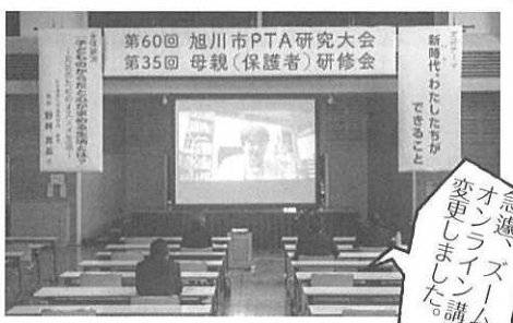
急遽、ズームでのオンライン講演に変更しました。