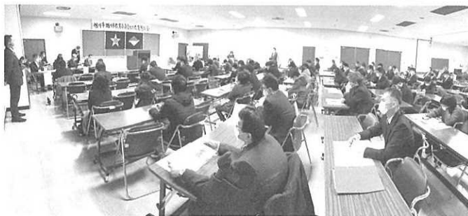
コロナウイルス感染防止に配慮して実施