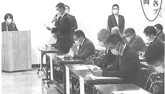
部会風景！本年度は、主に上川教育研修センターを会場に、熱のこもった話し合い！