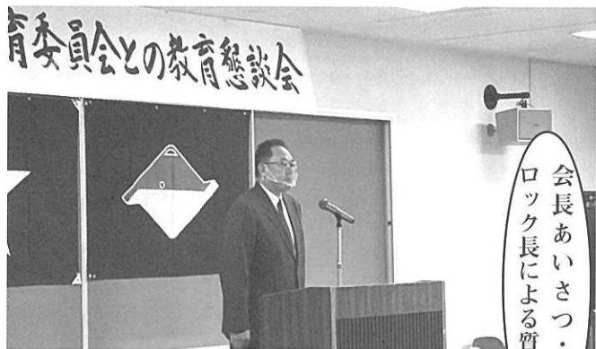
会長あいさつ・各ブロック長による質問