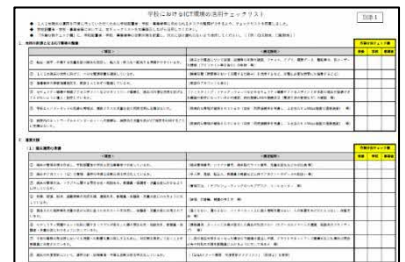
(※画像をクリックすると資料が開きます)

各学校や市町村教育委員会等において、円滑な1人1台端末等の活用に向けた計画を立てたり、取り組む内容を決定したりする際の参考として御活用ください。