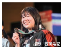
全日本選手権大会で、日本記録を樹立