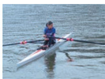
JOC エリートアカデミーに入校し、海外遠征などに参加

J-STAR 修了後、有望選手は、各中央競技団体の強化・育成コースに選出。オリンピック、パラリンピックをはじめ、世界で活躍できるトップアスリートを目指すために引き続きトレーニングを重ねていく機会が得られます。