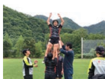
競技団体のコース選抜や育成・強化選手に選出