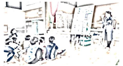
交通ルールを再確認

5月になると、暖かい日が続く、外で遊んだり自転車で出かけたりする子どもたちの姿が目立ってきました。5月26日(木)には1年生を対象にした交通安全教室「わかば教室」を行い、命を守るための交通ルールについて学びました。他の学年についても、日常的に交通安全指導を行っているところですが、ご家庭でも事故に巻き込まれることのないようお声かけをお願いいたします。なお、台風や吹雪、不審者等の状況に応じて、方面毎にまとまって下校させたり、お子様の安全を確保することが困難な場合には、マチコミメールや電話で保護者に連絡し、お迎えに来ていただいたりすることもあります。安全を第一に考えた対応に対し、今後ともご理解とご協力くださいますようお願いいたします。