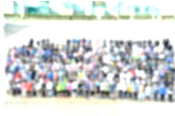
開校40周年記念 写真撮影の様子