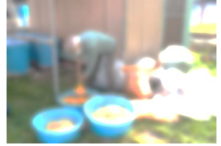
来春の学校園堆肥づくり