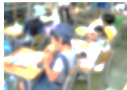
つがるのりんごを食べる様子

10月4日（火）、旭川産のつがるりんごが給食時に提供されました。旭川には6軒のりんご農園あるとのこと。子どもたちに地元でとれたりんごを食べてほしいという生産者の願いから、おいしいりんごを提供していただきました。旭川は朝晩の寒暖の差があるため、おいしいりんごが実る地域とのこと。子どもたちは、地元の食材のおいしさを味わっていました。10月6日（木）には、北海道産の砂糖と小豆を使用した「ぜんざい」をサザエ食品様から無償提供されました。きな粉とトッピングして、おいしく食べることができました。10月20日（木）には、今年度の世界料理として、台湾料理を味わいました。魯肉飯（ルーローハン）、蘿蔔湯（ルオポータン）、小籠包（ショーロンポウ）など、給食では珍しい献立だったこともあり、台湾のことを学びながら、興味深く食べることができました。10月24日（月）には、新米を味わう日として、旭川産の「ゆめぴりか」が提供されました。