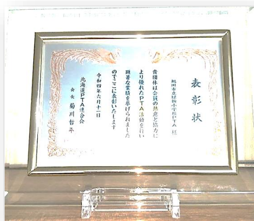
＜北海道PTA連合会 会長表彰盾＞

先にお知らせいたしました、本表彰に先立ちます5月14日(土)、旭川市PTA連合会より感謝状を頂戴しております。これは、令和3年度第68回北海道ブロック研究大会南空知・岩見沢大会の「特色あるPTA活動」分科会において、本会のこれまでの取組を「地域とともにあるPTA活動を目指して」～地域・家庭・学校の連携を生かして～として、プレゼンテーションする予定でしたが、残念ながら、コロナ禍により会合は叶いませんでしたが、「北海道の特色ある実践事例発表」として、その内容を役員さんがリレー形式で紹介。プロの撮影による動画となり全道に広く発信され功績が称えられました。かさねて、これらの功績が北海道PTA連合会に推挙され、6月11日(土)令和4年度道P連会長表彰も授賞しております。