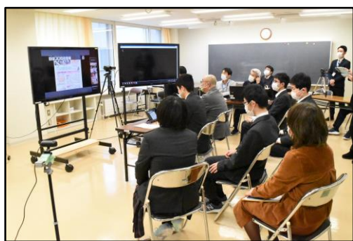
札幌、函館、旭川、帯広と距離を超えて生徒たちが会話を交わし情報交流

生徒からは「他校の生徒の話聞く機会があまりないので楽しかった」「他校の生徒がどのように活用しているのか知ることができて面白かった」「まだ行っていない活用方法があってとても勉強になった」などの感想が聞かれました。