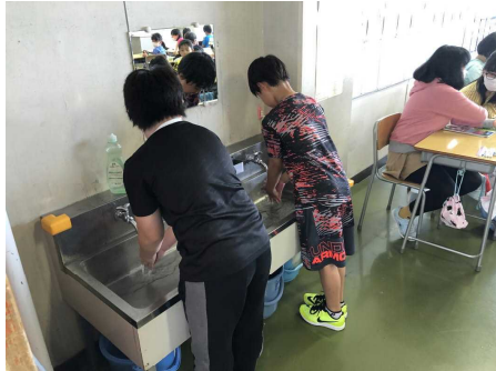
休み時間後の手洗いの習慣

子供たちは、「新しい生活様式」を意識して生活しています。教職員も指導だけでなく、放課後等に多くの児童が手を触れる箇所の清掃と消毒を行っています。