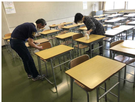
放課後の教職員での消毒作業