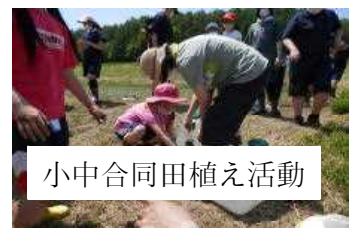
小中合同田植え活動