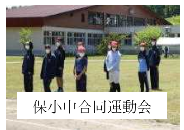
保小中合同運動会