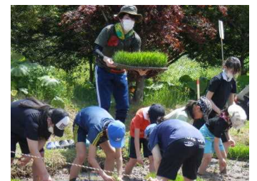
小中合同稲作活動