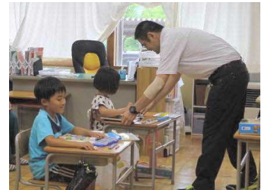
きめ細やかな 少人数指導