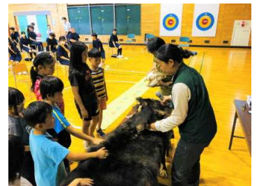
環境学習(クマ講座)