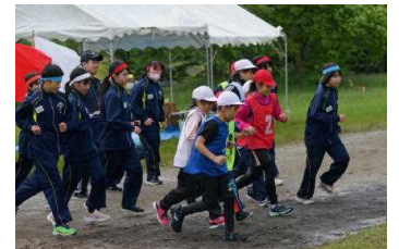
保小中合同運動会