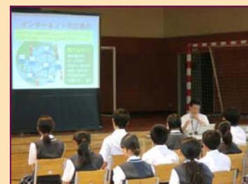
写真4 … 全学年で「夏休み学習会」を実施しました。また，PTAより大学生ボランティアを派遣いただき，3年生の学習をサポートしてもらいました。夏休みでも真剣に学ぶ姿が印象的でした。

写真3 … 1年生の「昼休みバスケ大会」です。時間は短くても，少しでも運動に親しもうとすることは大変よいことです。汗をふきながら5時間目の授業準備をする1年生にたくましさを感じます。