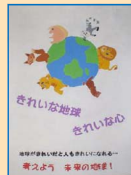
▲ 1年 〇〇 〇〇さん 佳作