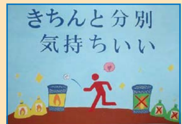
▲ 1年 〇〇 〇〇さん 佳作