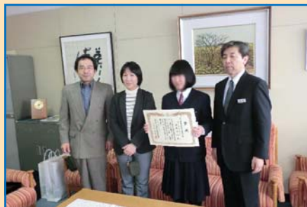
▲ 旭川中地区納税貯蓄組合連合会長賞に輝いた3年 〇〇 〇〇さんの授賞式の様子(校長室にて)