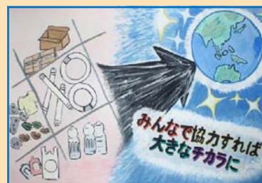
▲ 2年 〇〇 〇〇さん 佳作