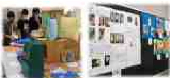
〈校内作品展の様子〉

子どもたちが夏休み中に作った作品を展示しました。中休みや昼休みには、友達の力作を鑑賞し合っています。それぞれがねらいをもって作成した工夫あふれる作品で互いのよさを認め合い、高め合っています。