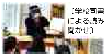
〔学校司書による読み聞かせ〕