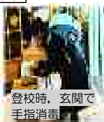
登校時、玄関で手指消毒

学校では、手洗い、消毒、マスク着用、換気をこまめに行っています。Tシャツ、短パンなど夏の服装やゲームやTVでの夜更かしもは体調を崩す原因にもなりますので、自分で健康管理できるようご家庭で声掛けをお願いします。