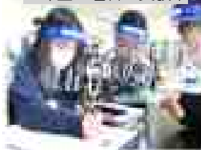
4年生 理科の実験中

児童一人一人が解決に向けて、主体的に取り組み、学びを深めました。今後も「やるべきことをやり、自ら考えて協力して行動できる」子どもを育てる工夫した授業づくりを進めてまいります。