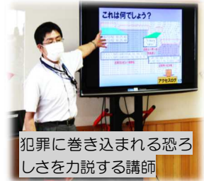
犯罪に巻き込まれる恐ろしさを力説する講師

「スマホは自分の部屋には持ち込まない。保護者やお家の人のいる前で使用するなど、家庭でのルールを決めて守ることが大きな鍵」というお話に子どもたちは大きく頷いていました。ご家庭でも話題にしてみてください。