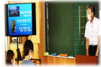
〈学校説明会の様子〉

「密」を回避するため、1日につき1学年の授業公開と学校説明会を行いました。今年度も学校と家庭の一層の連携・協働をお願いします。