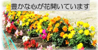
豊かな心が花開いています