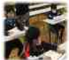
〈放課後学習会の様子〉

12月は計8回、延べ人数186名が参加しました。冬休み期間も自ら学習に向かえるようご家庭で見守りと声掛けをお願いします。