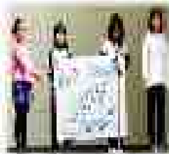
〈4年生: ゴミの行方を発表している様子〉

これからも、たくさんの人の愛を感じながら、一步一步前へ進んで行く私たちを見守っててください。そして、「愛される6年生」を目指して、青雲小学校のリーダーとして行動していきます。