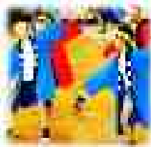
〈3年生が自分たちで考えた踊りを発表している様子〉