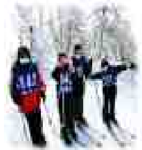
〈ゲレンデの子どもたち〉

講師としてシュプールクラブの方々、ボランティアとして保護者の皆様にご協力いただいています。ありがとうございます。子どもたちは、感染症対策をしながら、転び方や滑り方を徐々に習得し、安全に楽しくスキーをしています。