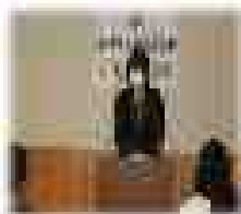
《同窓会入会式の様子》

3月19日、25名の卒業生が巣立って行きました。コロナ禍のため、参列の人数を制限し、会場には、ご来賓のPTA会長、同窓会長、そして卒業生保護者の皆様、時期リーダーの5年生が参列し、1年生から4年生は、教室でからリモートで参列しました。卒業証書授与の場面では、はっきりした大きな声での返事が響き、6年間学んだ青雲小学校を巣立つ者としての自信がみなぎっていました。