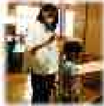
〈写真:身長を測定中〉

日々成長している子どもたち。自分の身体に関心をもって、自ら健康管理をしていく力を身に付けていけるよう規則正しい生活や運動習慣の定着を目指します。1日の運動の目安は60分。散歩やスポーツに限らず、部屋で掃除機をかけたり、浴室・浴槽を磨いたりするなど体を動かす活動を取り入れるなどご家庭でのご協力、よろしくお願いします。