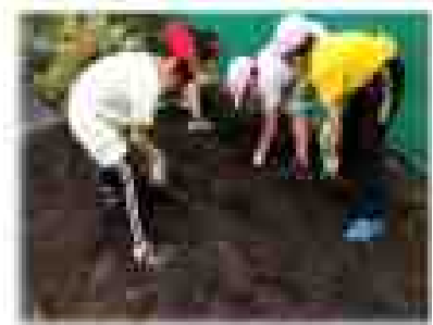
（感動しながら収穫している様子）

さて、朝夕めっきり涼しくなり、秋の訪れを感じる朝となりました。農耕園では、子どもたちが愛情こぼれに育てきたトマトやジャガイモなど、作物が見事に実りました。気候の変化や日照り、急な大雨で収穫にも負けず、作物（作物）は、私たちに大地の恵みを与えてくれます。子どもたちも、その力強い生命力を実感しながら過ごしています。