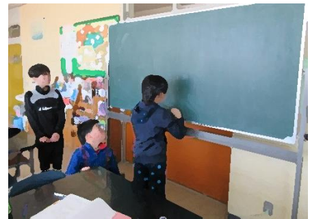
児童会文化委員会の活動の様子（4月10日）

1学期も後半にさしかかります、正和小学校では、子どもも、教職員もリーダーシップとフォロワーシップを十分に発揮して教育活動を進めて参ります。