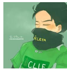
ネックウォーマー