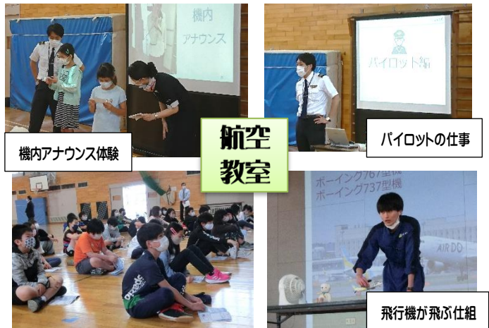
機内アナウンス体験