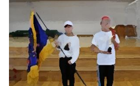
今年は白組優勝、赤組準優勝となりました。(10/12閉会式)