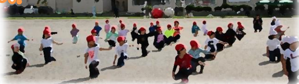
ダンシング玉入れ(1年)