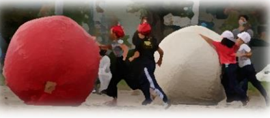
大玉くるくるくりん(2年)

秋晴れの下、3日間にわたり運動会が行われました。学年別実施でラジオ体操、徒競走、学年種目が行われました。平日にも限らず、たくさんの応援をありがとうございました。