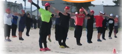
ラジオ体操(6年)「美しい!」