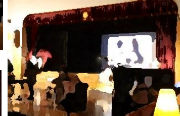
5年生 「ゼロ弾きのゴーシュ」

「伝えよう 成果と成長 そして感動を」のテーマの下、学芸会が開催されました。限られた練習時間で、感染症対策に十分配慮し「いまでできること(表現できること)」を追求したものとなりました。普段の生活・学習で培われた力を一人一人が発揮していました。