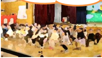
1年生 「おむすびころりん」