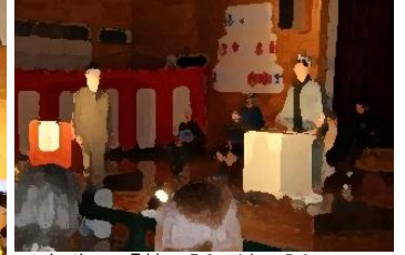
6年生 「昔話法廷 ～みんなで判決を考えよう～」