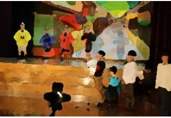
3年生 「たいらばやしでんしき」