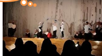
2年生 「しんとピクトグラム」