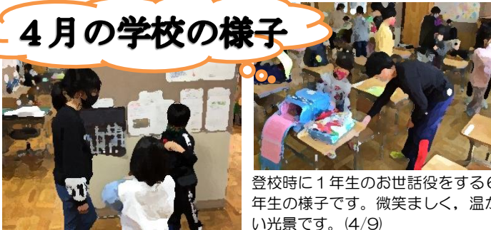
登校時に1年生のお世話役をする6年生の様子です。微笑ましく、温かい光景です。(4/9)