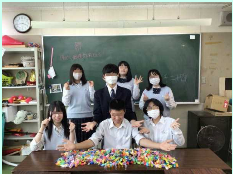
生徒会と各学級から集まった千羽鶴