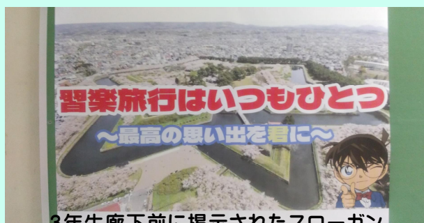
3年生廊下前に掲示されたスローガン