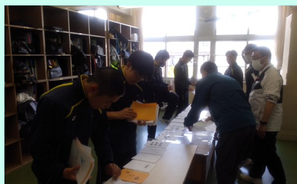
5月9日に行われたしおり丁合作業