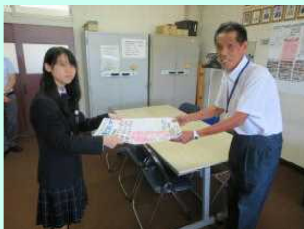
ポスターを公民館長に贈呈している様子です