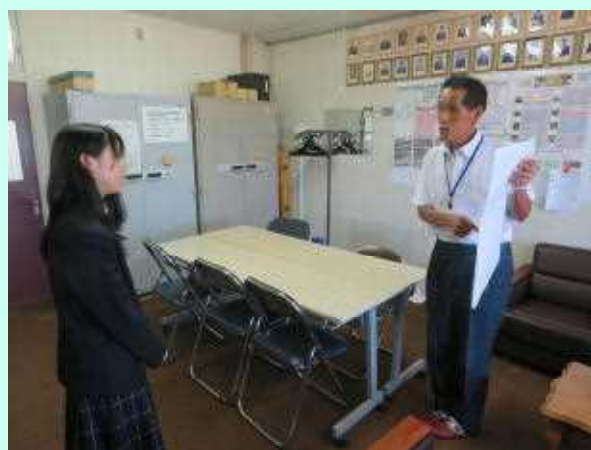
公民館長が作成されたポスターについて尋ねている様子