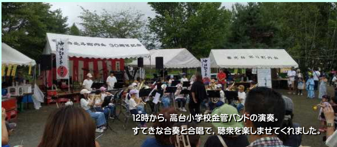
12時から、高台小学校金管バンドの演奏。 すてきな合奏と合唱で、聴衆を楽しませてくれました。

7月28日（日）朝まで降っていた雨も止み、中学校の隣にある5条公園にて北斗町内会夏祭りが盛大に開催されました。昼からは、高台小学校の金管バンド、春光台中学校の吹奏楽部が演奏し、お祭りに花を添えていました。