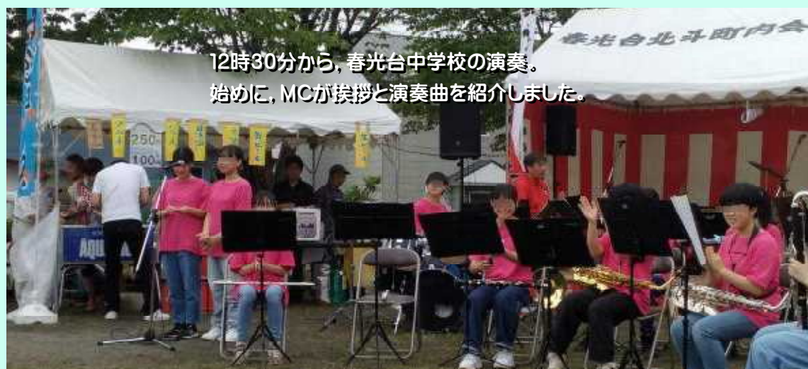
12時30分から、春光台中学校の演奏。 始めに、MCが挨拶と演奏曲を紹介しました。