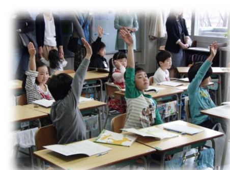
2年生「国語：ふきのとう」

16日(日)に、平成29年度の最初の全校参観日を行いました。 参観授業の後は、PTA総会、学年・学級懇談を行いました。