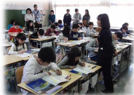
5年生「社会：わたしたちの国土」