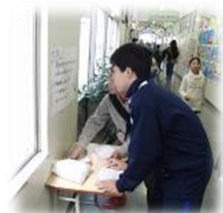
学校クイズラリー