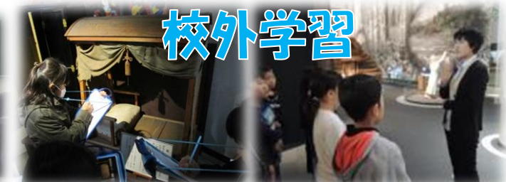
兵村記念館 & 博物館(4年)