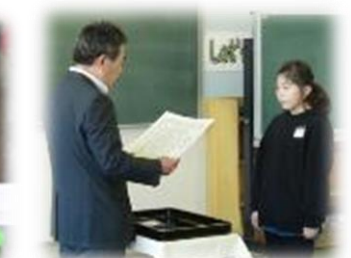
10/27 人権の花 感謝状