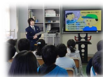
11/6薬物乱用防止教室