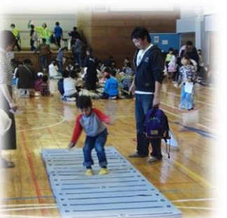
東栄オリンピック