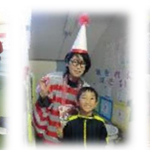
ウォーリーをさがせ！