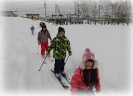
12/1・13 交流給食 (違う学年と) 12/19 縄跳び発表会 12/20 1年生スキー (学校築山)